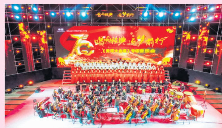
学校举行《黄河大合唱》专场音乐会